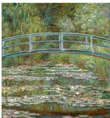
Ponte Sobre Uma Lagoa de Lírios de Água (1899)