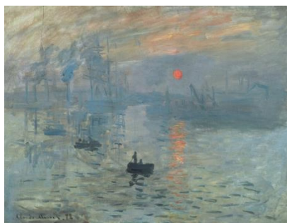
Impressão, Nascer do Sol (1872)